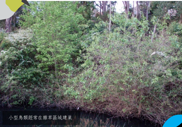
小型鳥類經常在雜草區域建築