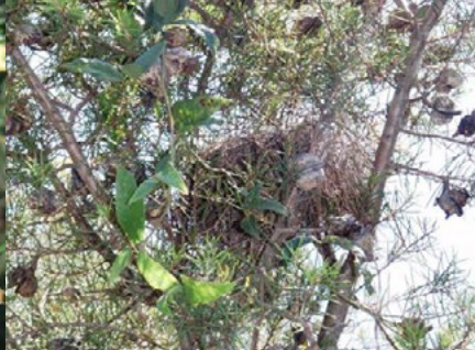
鸚鵡的鳥巢在哈克木上