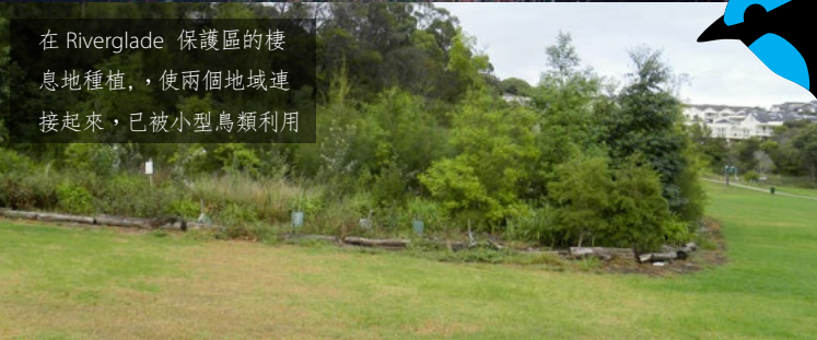
在 Riverglade 保護區的棲息地種植，使兩個地域連接起來，已被小型鳥類利用